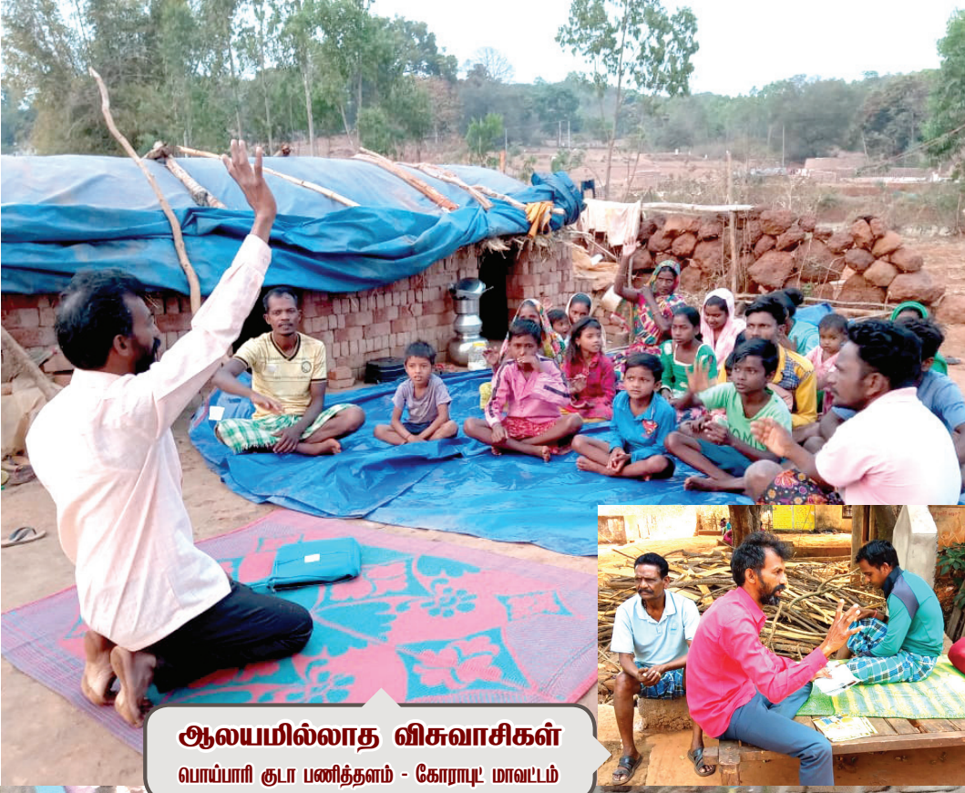
ஆலயமில்லாத விசுவாசிகள் பொய்ப்பாரி குடா பணித்தளம் - கோராடி மாவட்டம்